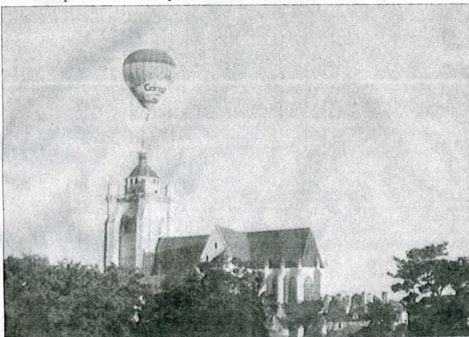
Impossible de rater les montgolfières dans le ciel dolois ce week-end

Des nacelles qui s'élèvent, des toiles qui se gonflent, une flopée de montgolfières de toutes les couleurs. Le stade du Pasquier se transformera en piste de décollage. Compétition et convivialité seront les maîtres mots ce week-end. Les concurrents seront départagés selon les règles de calcul des points des championnats de France. Et pour éviter tout embouteillage dans les airs, les montgolfières s'affronteront par deux lors de deux